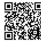
Video - St Martin auf der Erzählschiene

heute feiern wir das Fest des Heiligen Martin. Unsere Laterne strahlt hell. Die Laterne macht uns Mut: Wir können selbst Licht in die Welt bringen! Genauso wie der Heilige Martin. Danke, Gott, dass Du uns Menschen Mut machst. Amen.