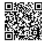
Video - Schattentheater St Martin